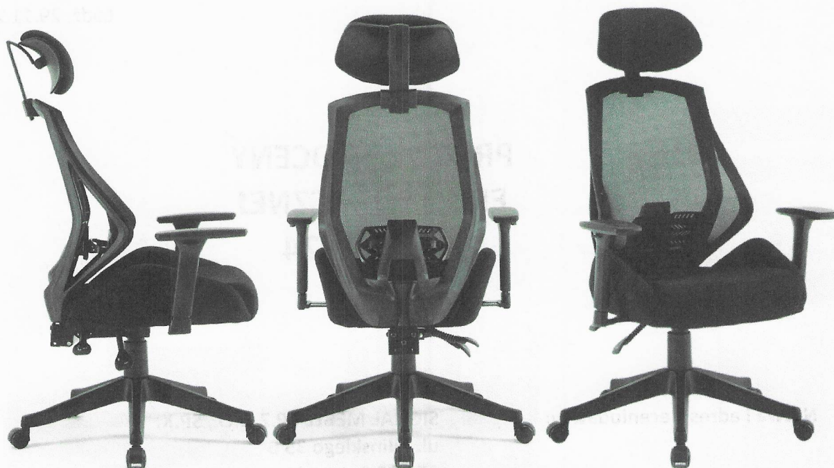
Fotel biurowy obrotowy Q-406, Q-406 M

Fotele obrotowe serii Q-406, Q-406 M to fotele (różniące się jedynie rodzajem tapicerki) na amortyzatorze gazowym z oparciem połączonym z siedziskiem przy wykorzystaniu synchronmechanizmu, które w połączeniu z możliwością regulacji wysokości siedziska oraz kąta nachylenia oparcia, a także odpowiednimi profilami siedziska i oparcia zapewniają możliwość dostosowania warunków siedzenia do anatomicznych potrzeb użytkowników. Zastosowany mechanizm umożliwia siedzenie dynamiczne i przyjmowanie zrelaksowanej, odchyłonej do tyłu pozycji ciała oraz właściwego fizjologicznego podparcia pleców, a zwłaszcza odcinka lędźwiowego kręgosłupa – niezbędnego podczas siedzenia dynamicznego.